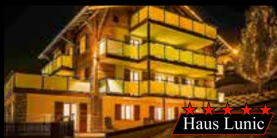
★★★★★ Haus Lunic