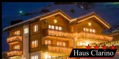
★★★★★ Haus Clarino