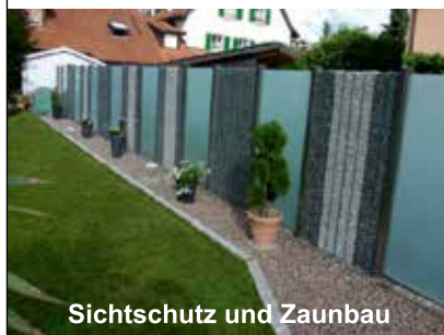
Sichtschutz und Zaunbau