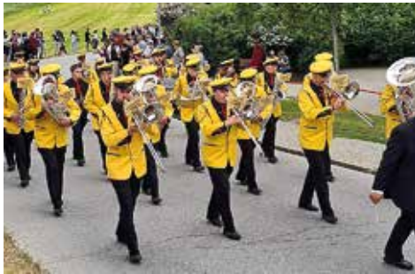
Einmarsch am Oberwalliser Musikfest Ried-Brig, 27. Mai 2023

Auch im Sommer konzertierte die MG Hannigalp anlässlich einiger dorfinterner Anlässe. Nach einer kurzen Pause nach dem Bezirks- und Oberwalliser Musikfest, sowie an Fronleichnam, spielten wir zum Apéro am Patronatsfest. Dies zu Ehren der diesjährigen Ehejubilaren. Weiter umrahmten wir die stimmungsvolle 1. Augustfeier, die dieses Jahr zum ersten Mal am Vorabend des Nationalfeiertages stattfand. In derselben Woche hielten wir ein Sommerkonzert ab, wie schon 2021 während der „Food Night“. Trotz kühlem Abendwind und einigen herumfliegenden Notenblättern konnten wir ein gelungenes Konzert zum Besten geben. Die vielen Flanierenden, die sich eigentlich nur kurz hinsetzen wollten um das ganze Konzert zu hören, bestätigten dies. Als letzter Programmpunkt im Vereinsjahr 2022/23 stand zum Zeitpunkt des Redaktionsschlusses die Umrahmung des ersten Schwingfestes in Grächen bevor. Mit Freude führten wir die Schwingerkönigin und die stolzen Schwingerinnen zur Siegerehrung auf den Dorfplatz.